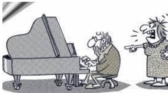
Rok 1854: Počátky Smetanovy hluchoty

Zázraky stvoření jsou tiché a jen v tichosti se jim můžeme obdivovat. I umění je plodem ticha. Jak jinak než v tichu lze přemítat nad obrazem či sochou, nad krásou barev a dokonalostí tvaru? Velké hudbě se naslouchá v tichu. Úžas,